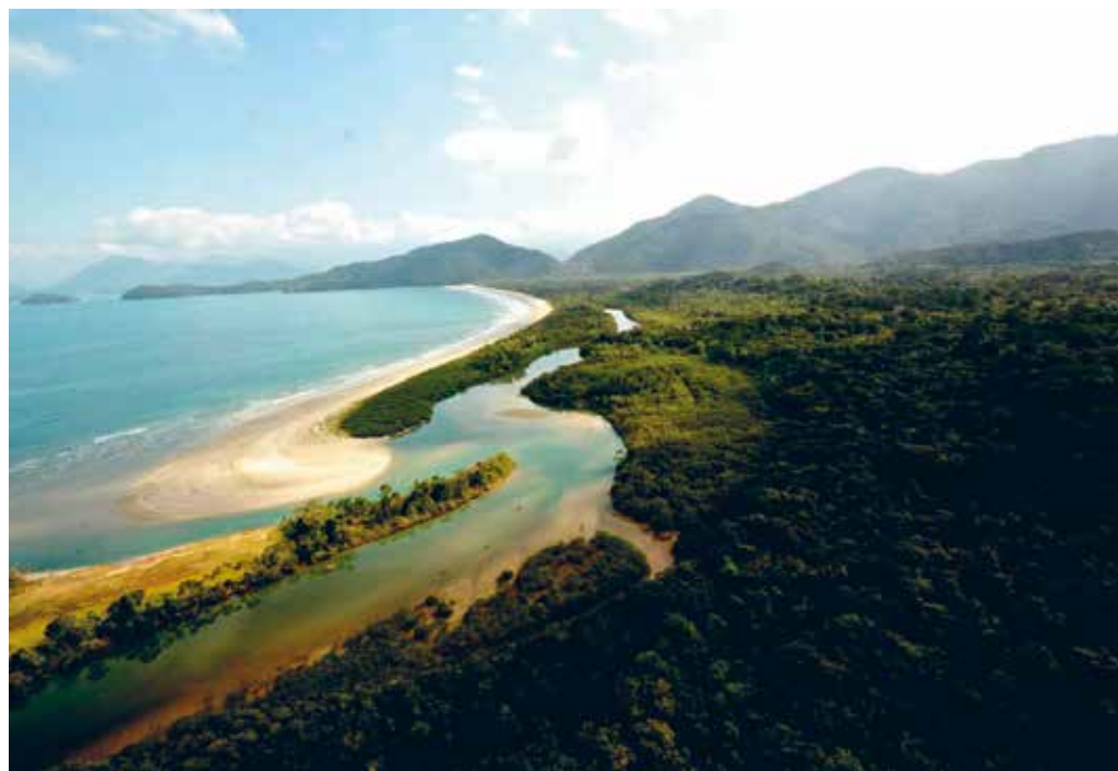
Praia e Rio da Fazenda, Picinguaba.