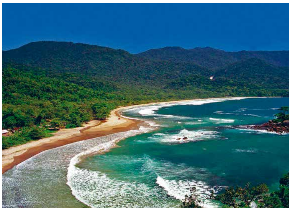
APA Marinha Litoral Norte - Sistema Ambiental Paulista

A Câmara Temática de Turismo Sustentável (CTTS) do Litoral Norte de São Paulo é uma das instâncias participativas do Observatório Litoral Sustentável, que tem por objetivo realizar a seguinte das ação estratégica da Agenda Regional de Desenvolvimento Sustentável do Projeto Litoral Sustentável: “Fortalecer e aprimorar a diversificação das atividades de turismo com foco principal no turismo de base comunitária”.