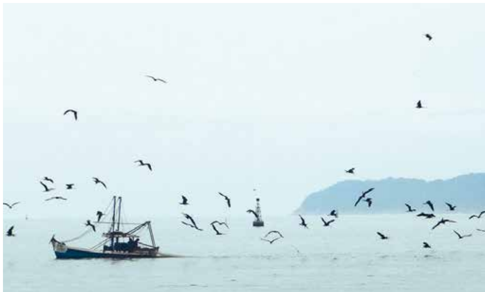
Apa Marinha Centro.

O Programa Nacional de Alimentação Escolar (PNAE) é considerado um dos maiores programas de alimentação escolar do mundo. Atende aos alunos da educação básica (educação infantil, ensino fundamental, ensino médio e educação de jovens e adultos) matriculados em escolas públicas, filantrópicas e em entidades comunitárias (conveniadas com o poder público). O programa contribui para o desenvolvimento da aprendizagem, favorecendo o rendimento escolar dos estudantes e a formação de hábitos alimentares saudáveis.