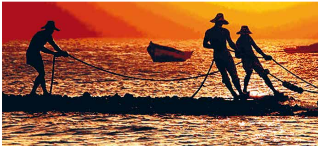
Pesca artesanal Litoral Norte

Para levar adiante a proposta de inclusão do pescado na alimentação escolar, foram elencadas pelos participantes da oficina, tanto representantes do poder público quanto os pescadores, diversas frentes de ações, como podemos observar pela leitura deste relatório. Porém, no entender dessa relatoria, não há como priorizar e administrar a infraestrutura para uso comum sem discussão, organização e capacidade de gestão por parte das organizações de pescadores artesanais e pelas próprias prefeituras. Portanto, em nosso entendimento, a assessoria técnica deve ocorrer simultaneamente à implantação da infraestrutura.