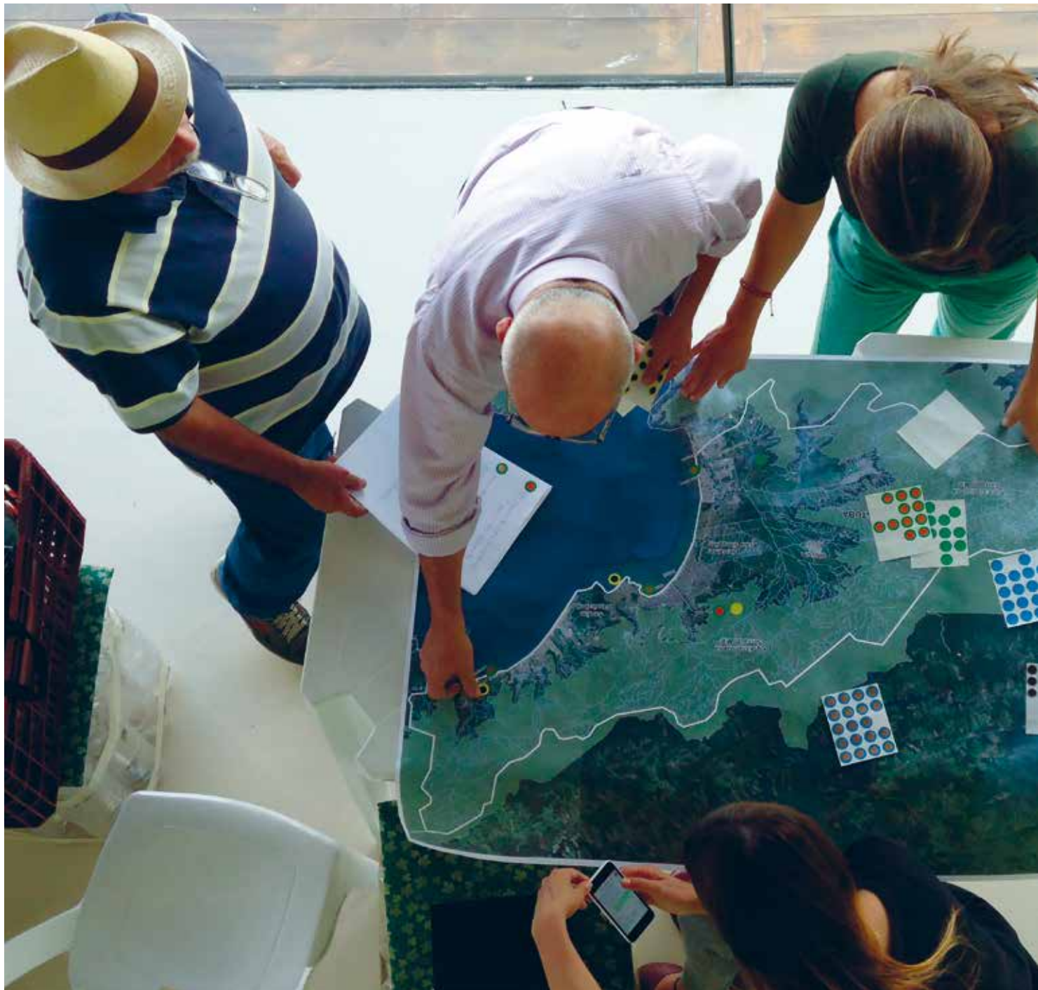
Mapeamento dos atrativos turísticos do Litoral Norte pela Câmara de Temática de Turismo Sustentável.