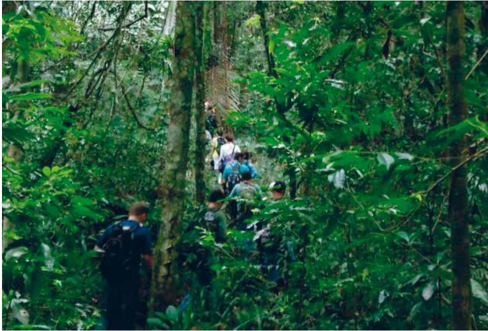
Trilha Cambury-Trindade, Litoral Norte.

A região do Litoral Norte de São Paulo detém uma predominância territorial de unidades de conservação caracterizada como um mosaico de áreas protegidas de conservação ambiental e cultural, além de importante corredor ecológico, com a presença de povos e populações tradicionais (caiçaras, indígenas e quilombolas), e forte vocação e potencial para o desenvolvimento de turismo sustentável e base comunitária.