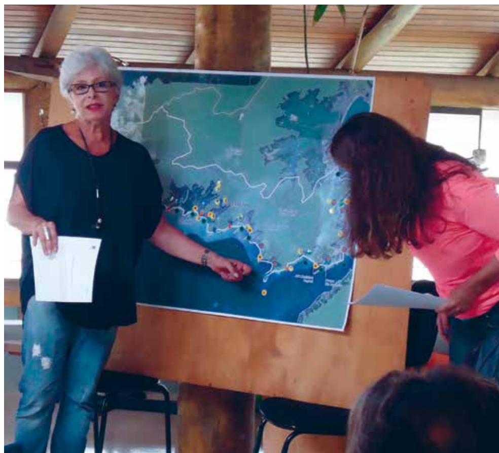
Plano para a viabilização da pesca artesanal