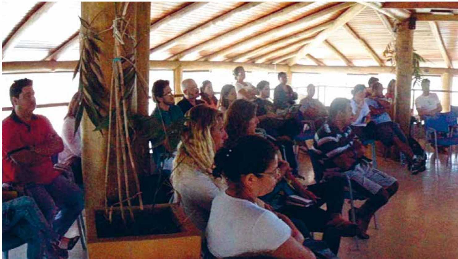
Plano para a viabilização da pesca artesanal

Reunião da Câmara Temática de Turismo Sustentável: Foto: equipe Pólis