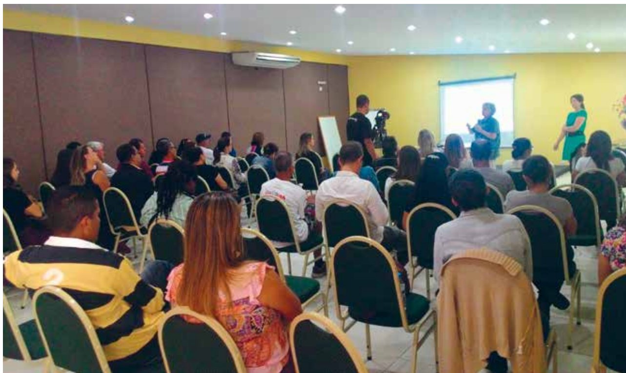
Oficina para inclusão do pescado no PNAE, Caraguatatuba, Foto: equipe Pólis

As propostas abaixo resumem a sistematização das discussões dos quatro municípios realizadas na oficina. Foram divididas em três grandes temas agregadores: